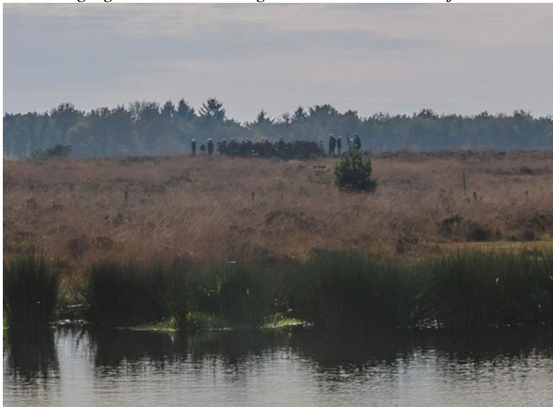
Trektelpost aan de Berg, Groote Peel

De vereniging is het hele jaar op allerlei gebieden actief. In korte sessies van 10-15 minuten word je door de coördinatoren geïnformeerd over de resultaten van dit jaar. Je zult versteld staan wat binnen de vereniging allemaal wordt gedaan en wellicht wil je aan een van deze activiteiten gaan deelnemen